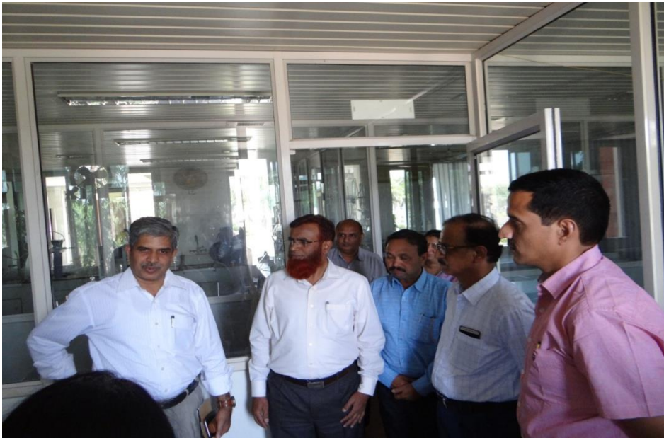
Freshers Welcome programme of 2019 batch